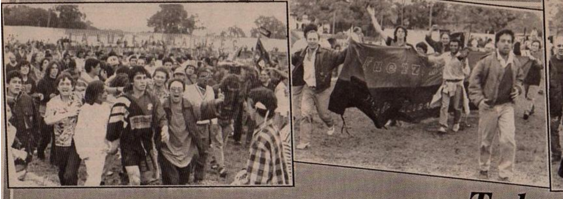
LA FIEL HINCHADA FESTEJA EL ASCENSO A LA "A"

CON MOTIVO DEL ASCENSO A LA "A" DE BASÁÑEZ, ÚLTIMAS NOTICIAS PUBLICÓ UNA ENTREVISTA, IMPERDIBLE A NUESTRO JUICIO, CON TRES GRANDES HOMBRES, ENTRE ELLOS, RAÚL VILA.