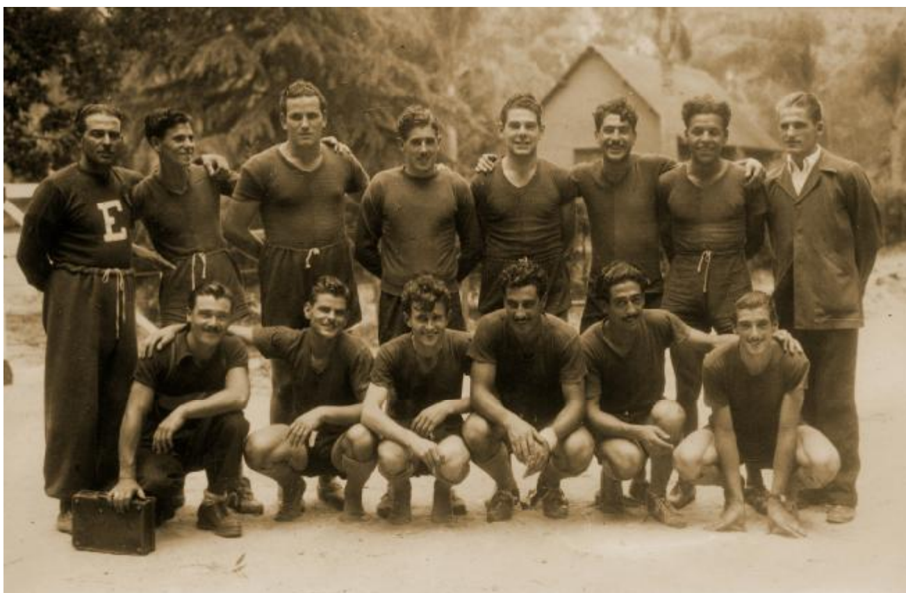
UNA ENTRAÑABLE FOTO DE LOS MUCHACHOS DE ANTES