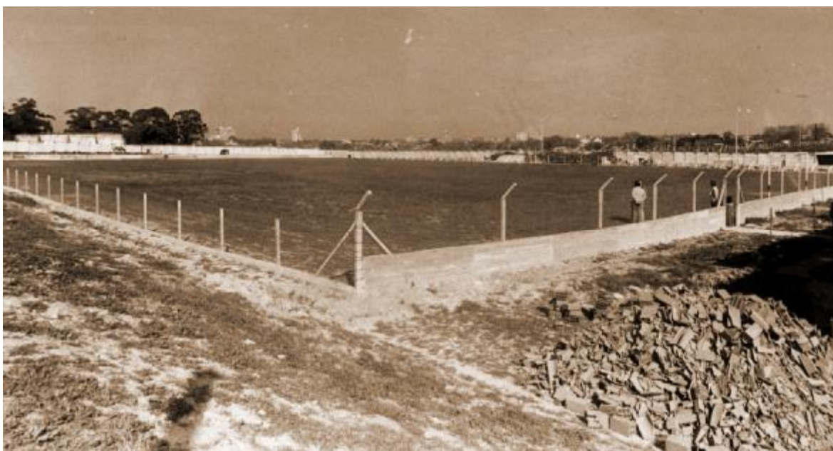
El sueño se hizo realidad: cancha propia “La Bombonera”

Quinta, la propia!! : Estadio “La Bombonera” Palma de Mallorca 4406. La cancha actual es propiedad del Club. Sus terrenos (ver nota aparte) fueron comprados con esfuerzo y la colaboración mancomunada de dirigentes, socios, hinchas vecinos y comerciantes de la zona. Muchas de estas personas fueron las mismas que oficiaron como mano de obra en forma honoraria para la construcción de sus instalaciones, hecho que la convierte en algo casi inédito, y que es motivo de orgullo para los “Basañistas”. Se inauguró el 11 de noviembre de 1981 , con un partido oficial por el Campeonato Uruguayo de la “B” entre Basañez y Racing que terminó en empate 1-1