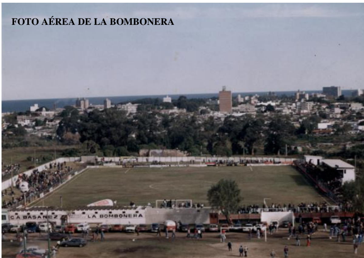
FOTO AÉREA DE LA BOMBONERA

(diario “La Mañana” Montevideo, sábado 17 de octubre de 1981)