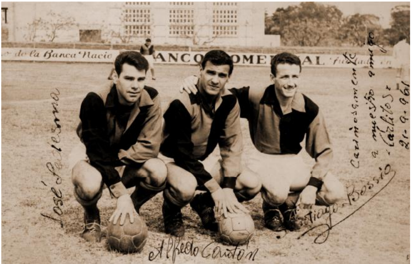
ESTAMPA DE CAMPEONES, LOS QUE EN EL 60 ASCENDIERON A LA "B"